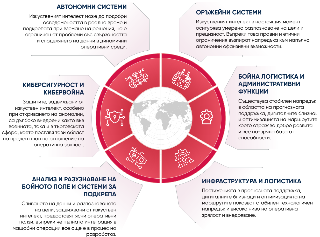
Фигура 3. Потенциални приложения на ИИ за военни цели