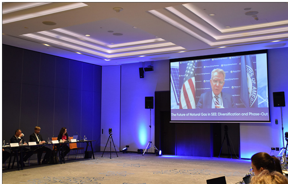
Помощник-държавният секретар на САЩ по енергийните ресурси Джефри Пайът говори пред аудиторията на кръглата маса „Бъдещето на природния газ в Югоизточна Европа“, София, март 2023 г.

дигитална сигурност в Европа, енергийна сигурност и стратегическо отделяне от Русия. Благодарение на използването на платформи за стрийминг и виртуална конферентна връзка тези събития достигнаха до над 1 000 експерти и политици от Европа и САЩ.