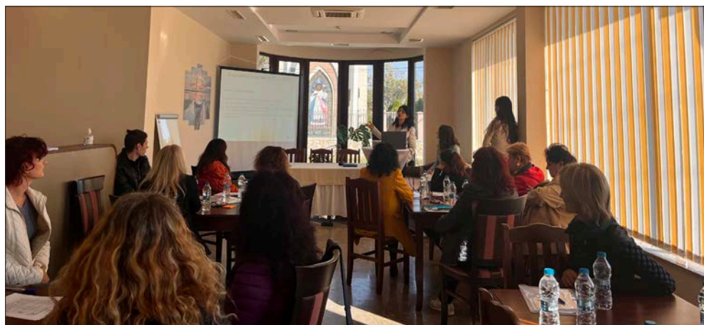
Жени от град Белене и региона по време на Лабораторията за гражданско действие, организирана от Центъра за изследване на демокрацията, 20 октомври 2022 г.

Лабораторията за гражданско действие в Белене през октомври 2022 г. беше проведена с цел изследване потенциала за енергийно гражданство сред жените от региона. Участничките се включиха в групови дискусии за ролята на енергията в живота им, степента на приемане на нисковъглеродните технологии и отношението им към създаването на енергийна общност като начин за справяне с енергийната бедност. Анализът на резултатите от лабораторията констатира, че участниците демонстрират жив интерес към енергийните теми и се стремят да се включват активно във вземането на решения относно потреблението на енергия в техните домакинства. Въпреки това гражданската им позиция като цяло е по-скоро индивидуална, а примерите за колективни усилия, насочени към повишаване на енергийната ефективност или внедряване на технологии за възобновяема енергия, са малко. Причините за слабата гражданска активност, особено по отношение създаването на общности за възобновяема енергия, са тромавите административни процедури, недостигът на информация и ограничените финансови средства.