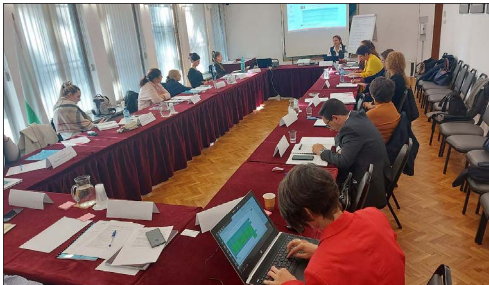
Пилотно приложение на програмата за обучение на специалисти по човешки ресурси от български институции.

Акцент в работата на Социологическата програма през 2022 г. бяха и расизмът, ксенофобията и расовата дискриминация. Центърът участва в изследване на Европейския парламент относно защитата срещу расова дискриминация и ксенофобия, като направи оценка на ефективността на законодателство на България, Унгария и Румъния в подкрепа на изпълнението на Плана за действие на ЕС за борба с расизма. Пандемията от Ковид-19 е утежила съществуващите проблеми с расизма и антициганизма в тези