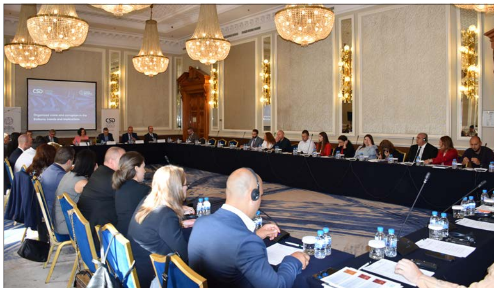
Международна конференция „Организирана престъпност и корупция на Балканите: Тенденции и перспективи“, София, 14 юли 2022 г.

Центърът, съвместно с консултантската компания ICF, Университета в