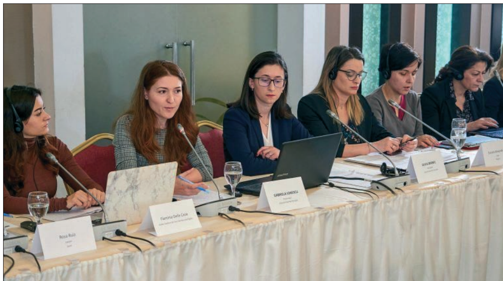
Международна конференция за защита правата на жените – жертви на насилие, Букурещ, 21 февруари 2020 г.