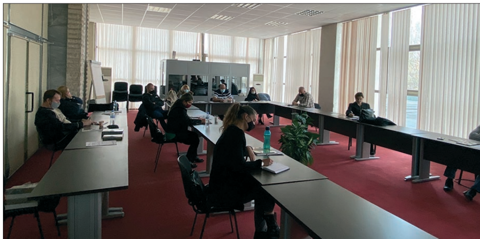
Обучителен семинар „Заподозрени и обвиняеми с психосоциални нарушения и интелектуални затруднения – идентификация, комуникация, участие и права в наказателния процес“, София, 24 ноември 2020 г.

казателното производство. Основният му компонент е „Методология за идентифициране на психосоциални и интелектуални увреждания при заподозрени и обвиняеми лица“ , в която се излагат принципите за изграждане на професионални умения по отношение на спазването на правата на уязвимите групи и за вземане на информирани професионални решения. Наръчникът „Идентифициране и комуникация със заподозрени и обвиняеми лица с интелектуални и психосоциални увреждания“ съдържа практически насоки, съобразени с уязвимото положение на страдащите от подобни нарушения и гарантиращи спазването на правата им. Третият компонент е онлайн програмата за самообучение OPSIDIAttrain , която залага на практическия подход. Чрез платформата служителите от системата на наказателното правосъдие имат възможност виртуално да отиграт ситуации като среща, идентифициране и комуникация с лица, страдащи от най-разпространените интелектуални затруднения и психически