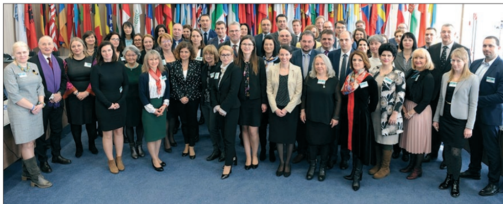
Международна конференция „Ефективни стратегии за наказателно правораздаване срещу насилието, основано на пола, в Източна Европа“, Виена, 5-6 март 2020 г.