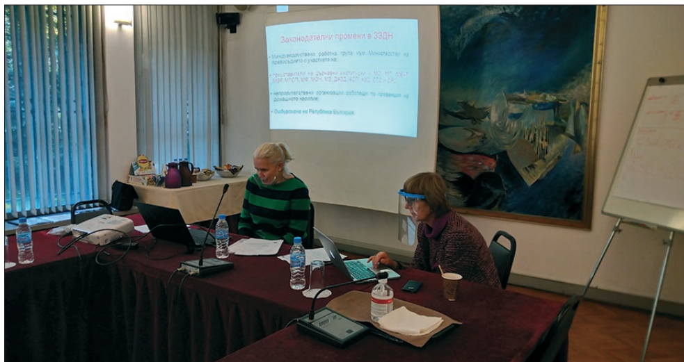
Работна среща, посветена на добрите практики в наказателното правосъдие при работа с жертви на престъпления, София, 23 октомври 2020 г.