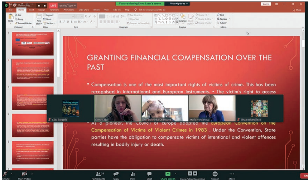
Онлайн обучение по финансова компенсация на жертвите на трафик на хора – граждани на трети страни, 11-12 юни 2020 г.

тидисциплинарното сътрудничество при защитата им.