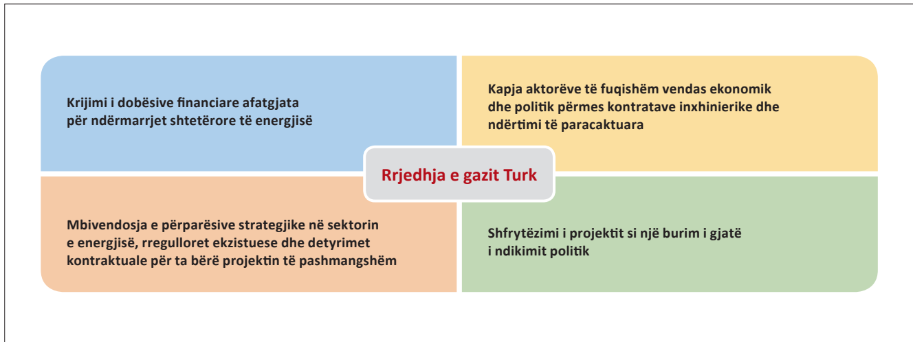
Figura 2. Modeli i përdorimit të Tubacioni të Gazit Turk si mjet për kapjen e shtetit nga Rusia