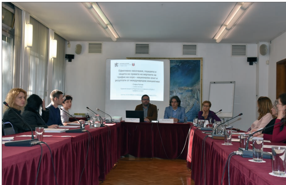
Кръгла маса „Защита на правата на жертвите на трафика“, София, 16 октомври 2018 г.

жените, пострадали от престъпления, целяща да подобри тяхното положение, вкл. чрез изследване причините за слабото докладване на престъпления срещу жени и преглед на процедурите за финансова компенсация на пострадалите.