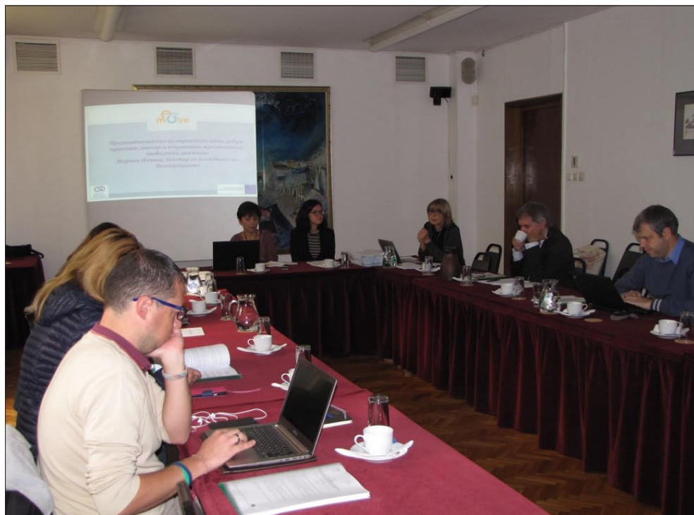
Правната програма представя движещите фактори и пречките за свободното движение на младите хора на национален семинар през октомври 2017 г.

следване на демокрацията продължи да събира данни и информация по различни аспекти на спазването на основните права в България. Успоредно с приноса към изготвянето на Годишния доклад за основните права на Агенцията, през 2017 г. Правната програма анализира проблеми като проявите на омраза срещу мюсюлмани и мигранти; ромските и странстващите общности; женомразството (мизогиния), стереотипите по полов признак и речта на омразата, насочена срещу жени; пречките, които срещат гражданите на ЕС при упражняването на правата си в друга държава членка; и статуса и полето на действие на НПО в сферата на зачитането и подкрепата