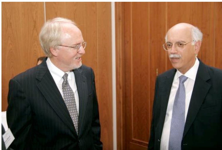
Посланик Байрли (вляво) и Андрю Нацис

посланик Байрли подчерта необходимостта от постоянна обратна връзка между демократичното управление и нуждите и ценностите на гражданите. Той очерта и ролята на гражданския сектор като посредник при възприемане на международната помощ за прехода в страната.