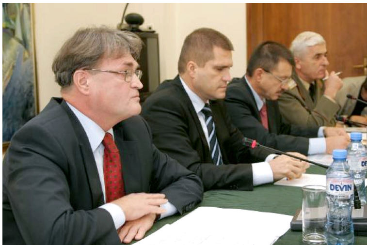
От ляво на дясно: посланик Тодор Чуров, зам.-министър на външните работи, Николай Цонев, министър на отбраната, посланик Бойко Ноев, генерал Златан Стойков, началник на Генералния щаб

Във въстпителните си думи при откриването на кръглата маса посланик Бойко Ноев, директор на Европейската програма на Центъра, и бивш министър на отбраната подчерта, че членството на България в НАТО, ускорената професионализация на армията, както и фактът, че Министерството на отбраната изпълнява задачите си в коренно променена среда, налагат приемането на нов закон.