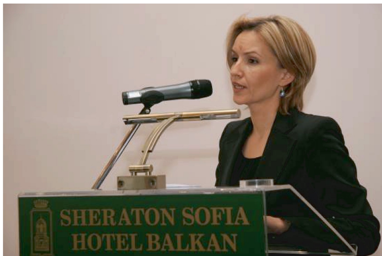
Министър Гергана Грънзарова

ледните години е приобцаването на страната към евро-атлантическите стандарти в областта на отбраната . В тази връзка, на 27 октомври 2008 г. Центърът за изследване на демокрацията проведе кръгла маса за публично обсъждане на проекта за Закон за отбраната на Република България. В кръг-