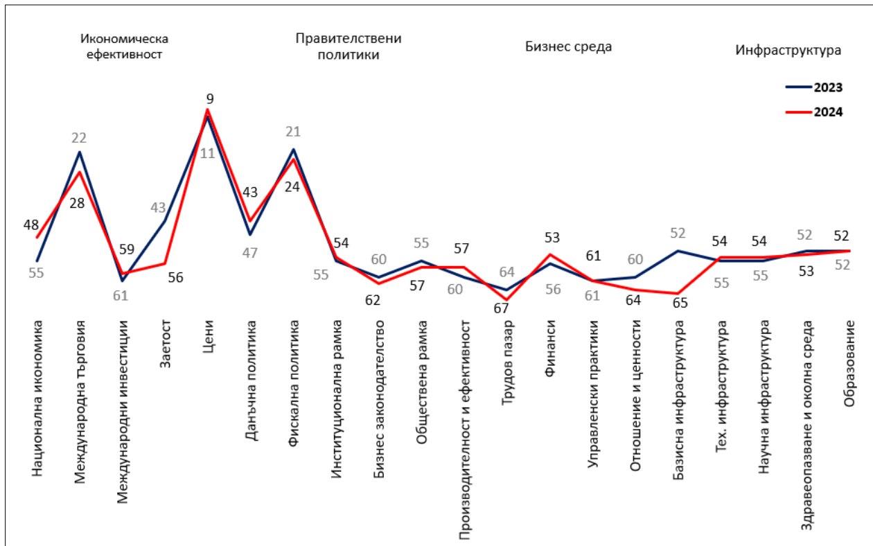
ФИГУРА 2. ПРОФИЛ НА КОНКУРЕНТОСПОСОБНОСТТА НА БЪЛГАРИЯ 2023 - 2024

Източник: Годишник на световната конкурентоспособност, 2024 г.